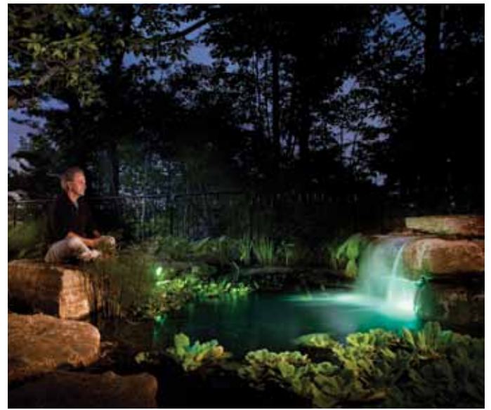
Situé devant la fenêtre de la salle à manger, le bassin traversant la cour latérale est devenu un jardin à contempler, un endroit propice à la méditation. L'éclairage au DEL renforce la magie d'ensemble.

paysager, n'ont pas tari d'éloges sur le projet. Ils ont entre autres souligné l'excellente intégration d'une œuvre d'art dans ce magnifique aménagement, la mise en évidence de différentes déclinaisons de vert, entre autres par le choix judicieux des végétaux, et la beauté des terrasses ouvertes aux lignes intéressantes, mettant le site en valeur. De plus, les juges ont été impressionnés par la reprise, dans la forme de la terrasse, de la courbe du pont qui ajoute dynamisme et originalité à cet aménagement de prestige. Sans compter que la création de multiples terrasses permet l'accès à une vue différente selon le moment de la journée. L'utilisation des pierres à proximité du plan d'eau, contribuant à la création de l'ambiance agréable et relaxante caractérisant cette réalisation, a aussi été mentionnée. Finalement, il fut mention de l'habile intégration de l'aménagement au paysage, intégration